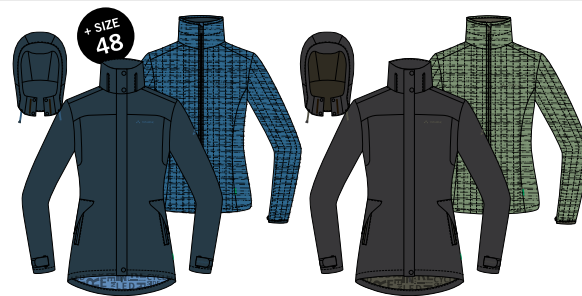
160 dark sea uni